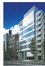
千代田テクノ本社ビル

個人放射線被ばく線量測定だけでなく、サーベイメータ、エリアモニタなど各種測定器の販売も行っており、作業環境測定サービスや環境用ガラスバッジを用いた環境線量測定サービスも展開しています。パイオニアとして蓄積してきた技術力やノウハウを総合的な放射線安全管理サービスに集約させ、お客様に「安全と安心」をご提供しています。