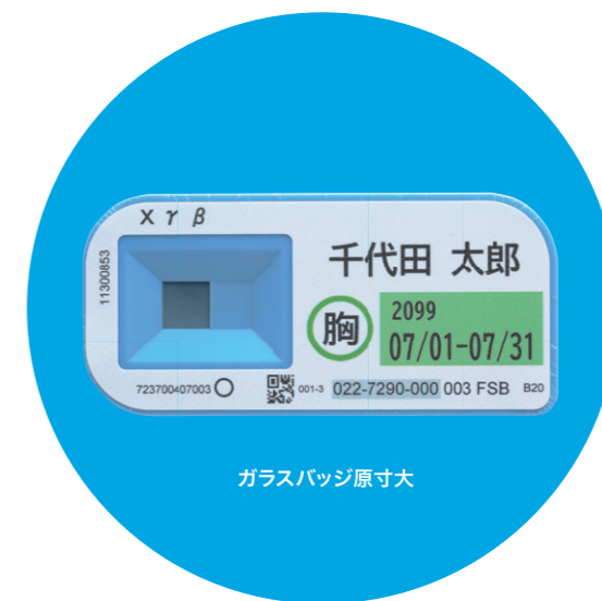
ガラスバッジ原寸大