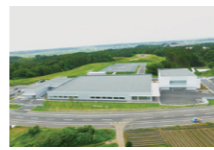
測定センター(ラディエーションモニタリングセンター)

弊社の測定センター(ラディエーションモニタリングセンター)では、ガラスバッジの組立・発送と受付・計測を最新のテクノロジーを集約させ自動化しています。現在、月間処理件数は46万個にも及び国内で最大規模を誇っています。なお、ガラスバッジによる測定値のご報告は実に延べ9,300万件を超えるまでになっています(2024.11)。